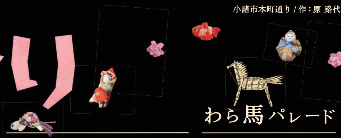
小諸市本町通り / 作: 原路代